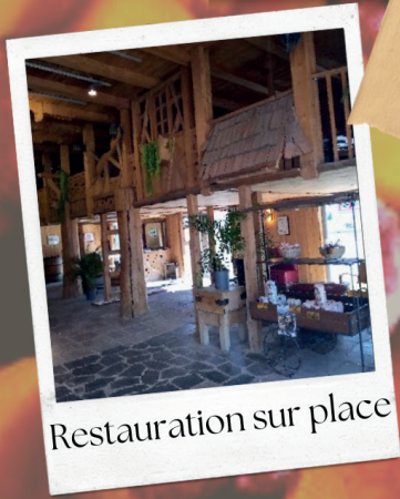
Restauration sur place