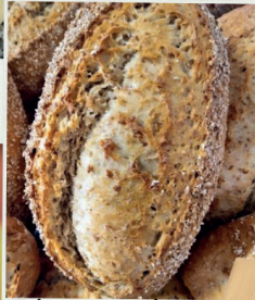
Divers pains spéciaux